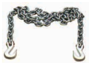
Art. 3002S | Catene di tiro Pull chains